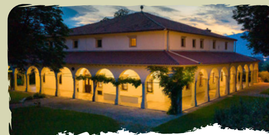
IL PALAZZO ZEMONO il palazzo tardo rinascimentale con il ristorante d'alta cucina