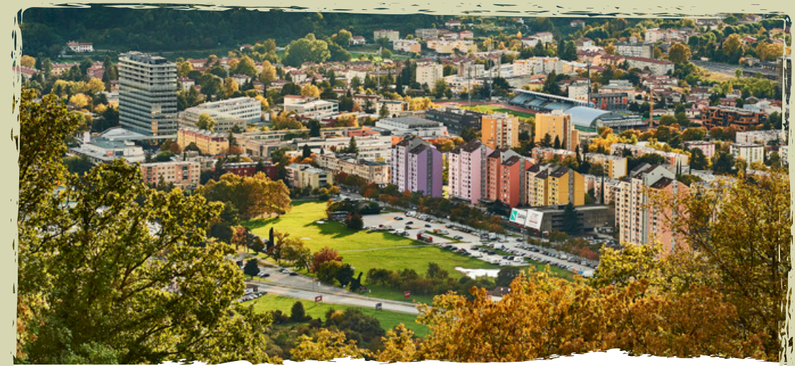
NOVA GORICA | l'originale conurbazione con Gorizia

L'area moderna della Goriška caratterizzata dalla cooperazione transfrontaliera si sta sviluppando in uno spazio unico in Europa, all'insegna della convivenza pacifica con un intreccio di culture. Scoprire il patrimonio da entrambe le parti del confine, sostare sulla piazza comune di Gorizia e Nova Gorica e osservare come il confine si dissolva nella vita quotidiana è per ogni viaggiatore un'esperienza indimenticabile.