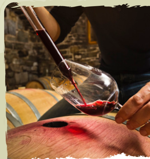
I VINI DELLA VALLE DEL VIPAVA l'abbondanza delle varietà vinicole

la visita del caseificio con degustazione dei formaggi locali