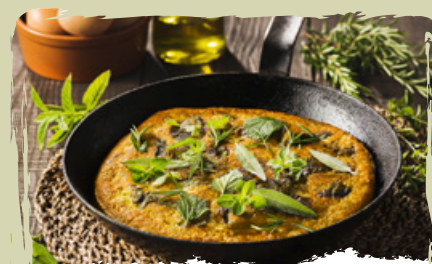
I PIATTI LOCALI il ricchissimo patrimonio gastronomico