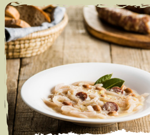
LA JOTA DELLA VALLE DEL VIPAVA l'amato minestrone tradizionale