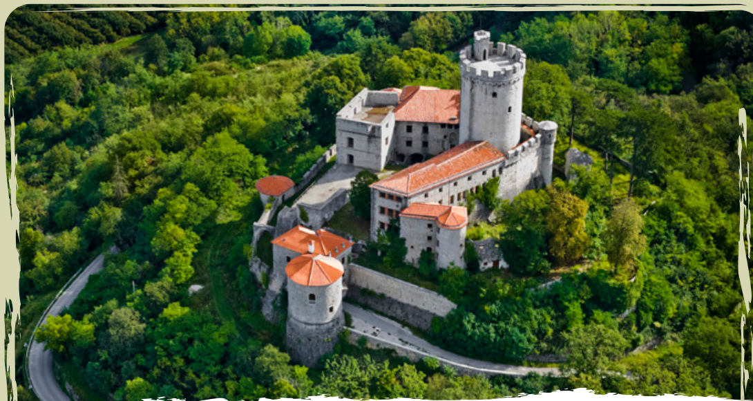
IL CASTELLO DI RIHEMBERK | l'imponente castello medievale che regna sopra Branik

Particolarmente prezioso è il patrimonio culturale che si è conservato nonostante una storia turbolenta. Due biblioteche monastiche antiche, a Vipavski Križ e Kostanjevica, come anche numerose opere d'arte presenti in castelli e chiese rappresentano un patrimonio inestimabile della Valle del Vipava e dell'ex area cosmopolita del Goriziano.