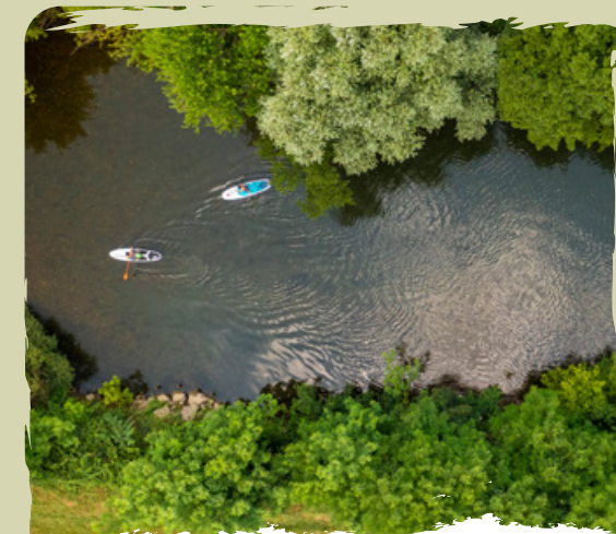
SUP E KAYAK il fiume Vipava per gli appassionati degli sport d'acqua