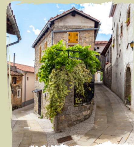
VIPAVSKI KRIŽ il borgo medievale fortificato