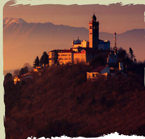
SVETA GORA il noto sito di pellegrinaggio con la basilica e il convento