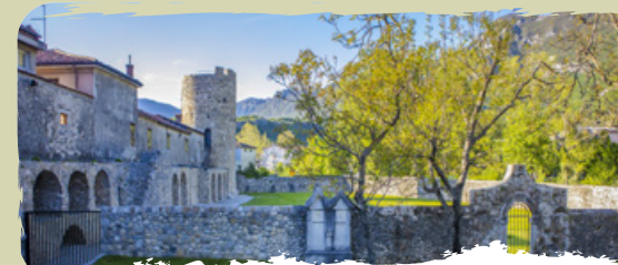
LA FORTEZZA ROMANA CASTRA le rovine degli antichi romani a Ajdovščina