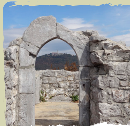
IL PARCO DELLA PACE SUL MONTE SABOTIN il parco tematico con le rovine della prima guerra mondiale