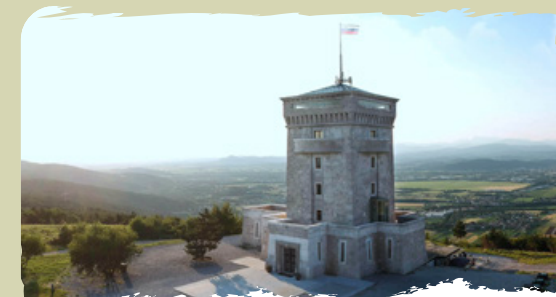
IL MONUMENTO ALLA PACE DI CERJE un'imponente fortezza-museo con una vista mozzafiato da Cerje