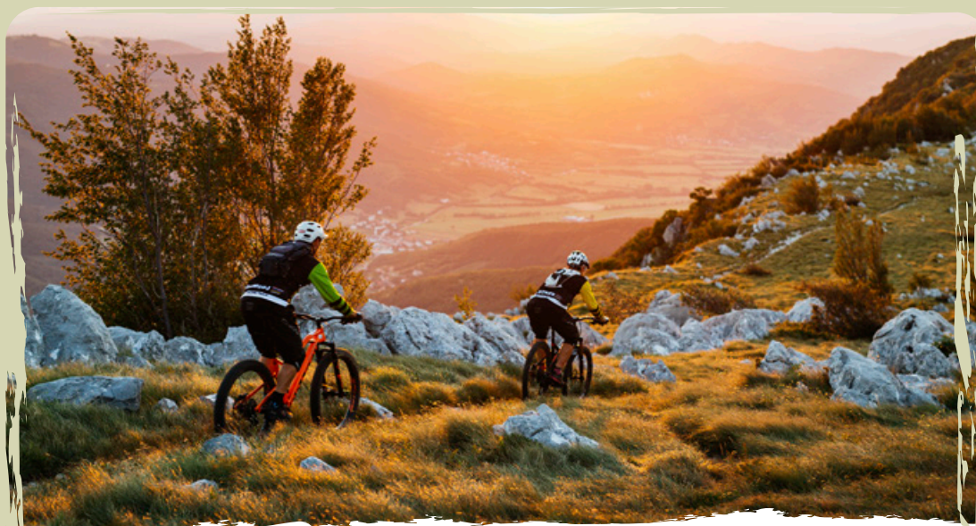
MOUNTAIN BIKE | per i percorsi ben curati degli altopiani carsici

Il paesaggio dinamico con oltre mille metri di dislivello funge da scenario perfetto per cimentarvi in attività e percorsi di difficoltà varia. La regione è il teatro di gare internazionali nella corsa in montagna e nel ciclismo.