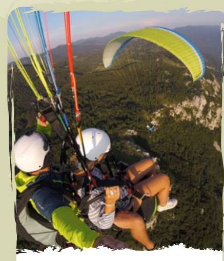
IL PARAPENDIO in tandem con la guida esperta