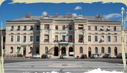
LA PIAZZA TRANSALPINA la piazza che accomuna le due città al confine