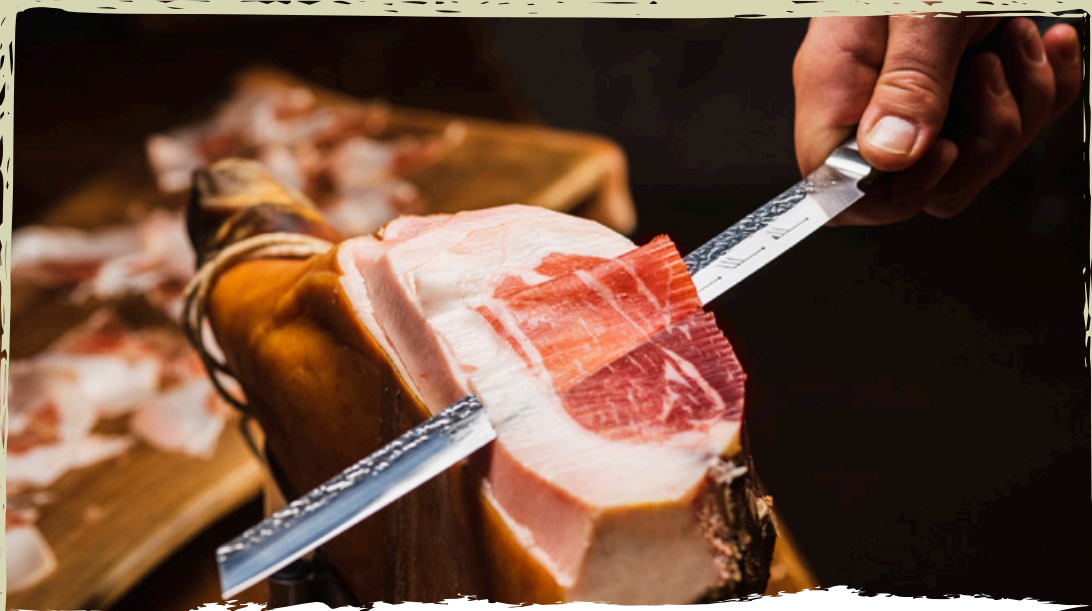
IL PROSCIUTTO DELLA VALLE DEL VIPAVA | il re della cucina locale

La Valle del Vipava, insieme ai dintorni di Nova Gorica, è considerata il giardino della Slovenia. La vasta gamma di ortaggi, in particolare il radicchio di Gorizia e l'asparago, esalta ulteriormente i piatti tipici. Da queste parti stagionano anche ottimi formaggi. Le specialità caserecce rispettano sempre le stagioni e sono create con ingredienti locali.