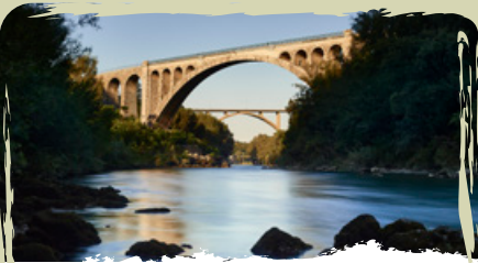
IL PONTE DI SOLKAN l'arco ferroviario di pietra più grande al mondo