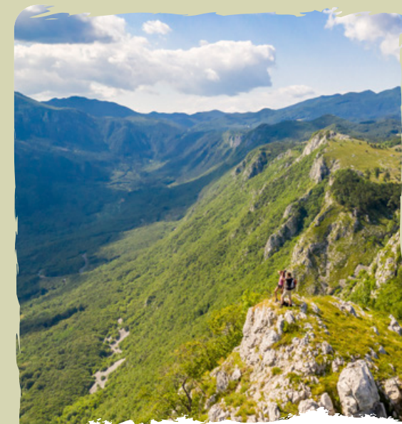
I SENTIERI ESCURSIONISTICI il fascino e i panorami mozzafiato