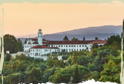
LA TOMBA DEI BORBONE la cripta dei reali francesi nel convento di Kostanjevica