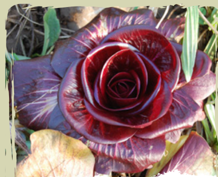
IL RADICCHIO DI GORIZIA tanto buono quanto gustoso